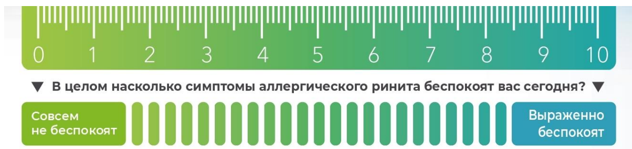
Рис. Визуальная аналоговая шкала

болезни. Далее расстояние до вертикальной черты измеряется в миллиметрах и выражается в баллах.